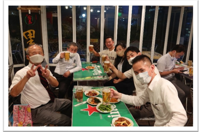
▲写真は、2022年7月27開催の新入会員・入会希望者交流会の様子