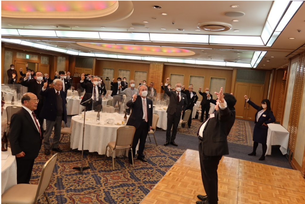
▲写真は、2023年2月21日開催の「早春の集い」の様子